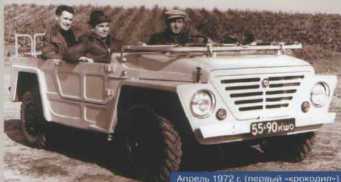
Апрель 1972 г. (первый «крокодил»)

31 июля 1975 года вышел судьбоносный приказ № 199 по Минавтопрому за подписью В.Н.Полякова о постановке на производство новой модели автомобиля повышенной проходимости ВАЗ-2121 «Нива».