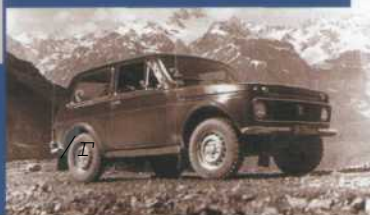
Государственные испытания, 1974 г.