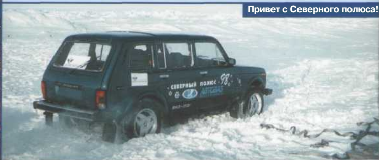
Привет с Северного полюса!